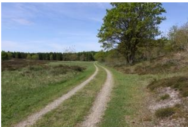
Finkehede i Frøslev Plantage