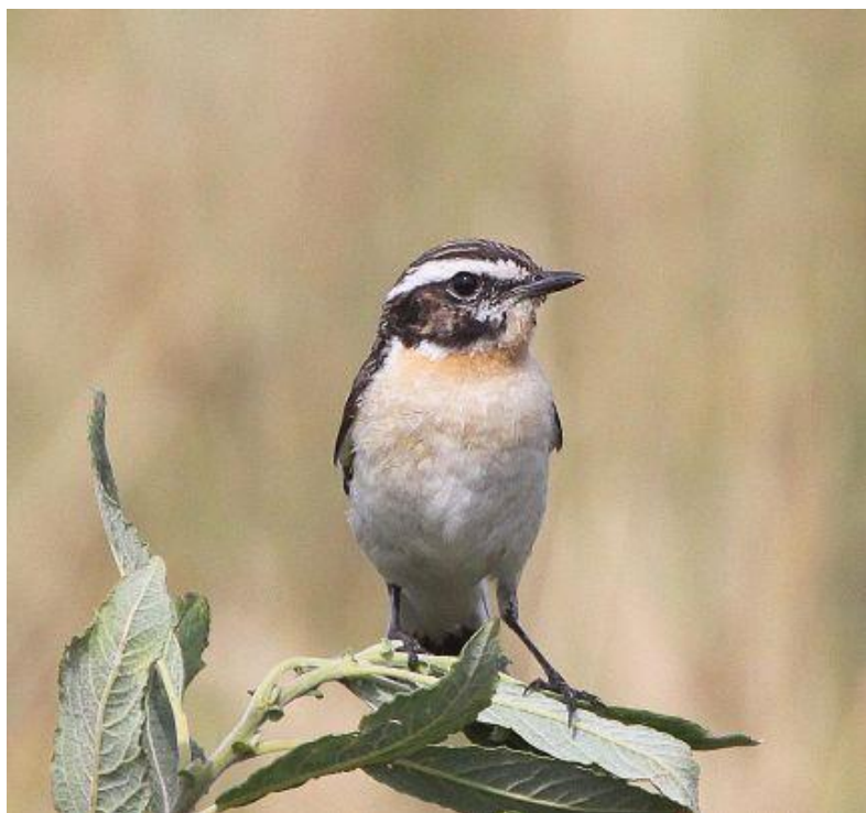
Bynkefugl, talrig i Mosen