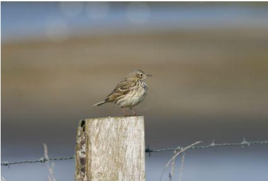
Engpiber, karakterfugl i Mosen