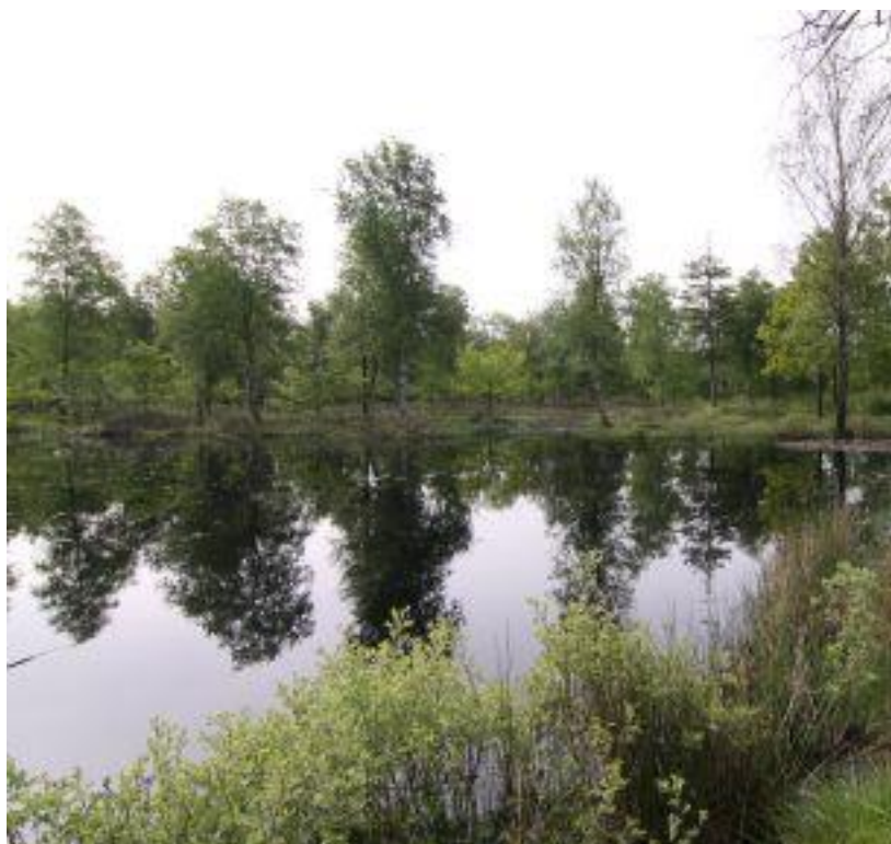
Kådnermose i Frøslev Plantage

Vigtige arter Hvepsevåge Rørhøg Hedehøg Engsnarre Trane Tinksmed Turteldue Stor Hornugle Mosehornugle Natravn Sortspætte Hedelærke Sortstrubet Bynkefugl Skovsanger Rødrygget Tornskade