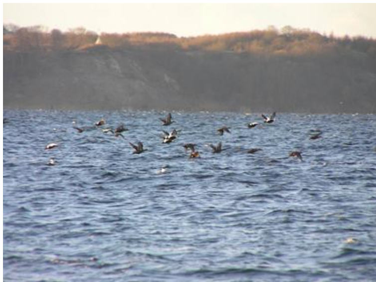
Ederfugle ved Kragesand