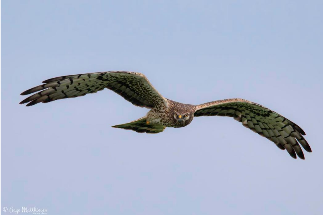
Hedehøg hun fra Harreby.

2022. I 2024 dannede de to fugle par ved Gasse Nyvang og i 2025 var de ynglepar ved Vester Gasse. Her i 2026 danner de igen par, men nu har de slået sig ned på en lokalitet, som er over 10 kilometer fra Gasse-området. Er det tilfældigt de danner par flere år i træk?