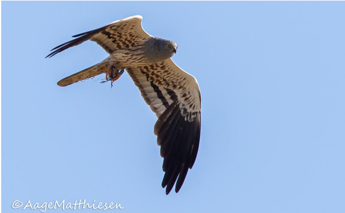
Han med bytte. Yngler ved Øster Gasse i år og er ringmærket som redeunge ved Fole 15. juli 2020.

sandsynlig en hun med unger i reden. Det er også nu hannen ses flyvende med bytte i kløerne. Ses en han transporter et bytte i juli måned, skal den stensikkert hen til en rede med det.