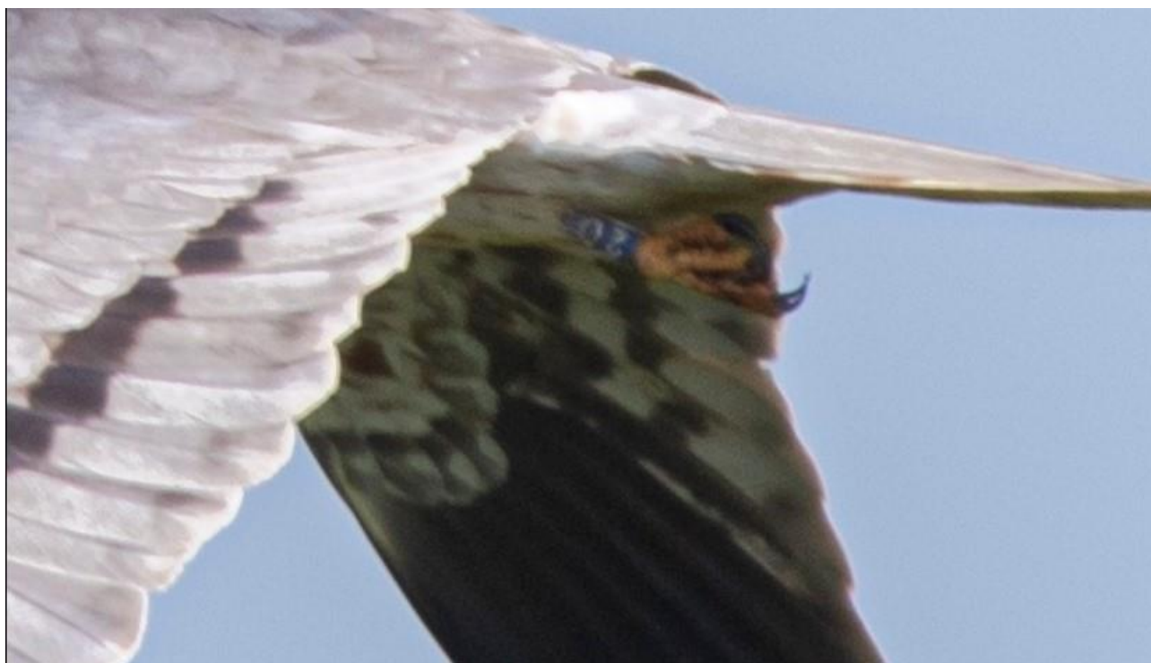
Voksen han med ring som viser den er mærket i Danmark 2021.

I gennem de seneste mange år, er ungerne blevet ringmærket med både en metalring og en blå plastik ring. Plastik ringene kan med lidt dygtighed aflæse – typisk ved at man får et godt foto, som der kan zoomes ind på. Det viser sig, at vi får en del af vores egne dansk-mærkede fugle tilbage som ynglefugle. Derfor er det vigtigt at vi sørger for at der kommer unger på vingerne af de danske reder, da det er dem som vender tilbage til Danmark for at yngle.