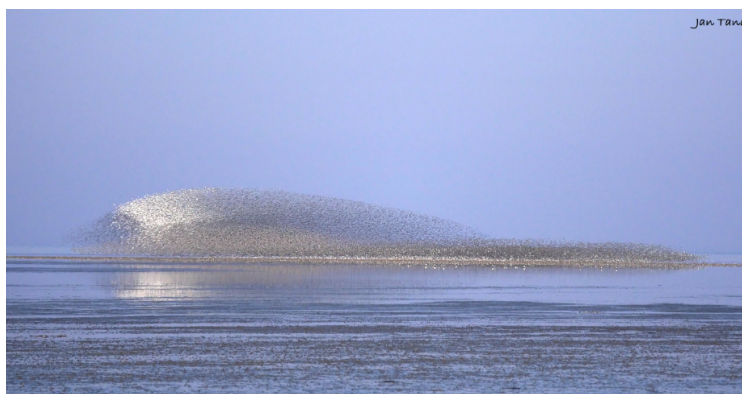
Hvid Sol fra Mandø

Når der samles så store flokke af ryler, kan man opleve fænomenet "Hvid Sol". Når de store flokke af ryler fouragerer ved Vadehavet, kan en sulten vandrefalk jage rylerne op. Rylerne vender under flugten skiftevis den hvide underside og den mørke overside frem i lyset, og det skaber en blinkende formation af ryler, som ændrer figur, ligesom man ser med Sort Sol.