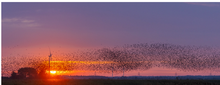
Sort Sol ved Hassberger.

Fugleflokkene om efteråret er store - og især ved Vadehavet samles ufattelige mængder af fugle. Den 12. september er der tæstet 36.000 almindelige ryler ved Ballum Forland. 16. september tælles 25.000 hjejler langs Rømødæmningen og samme dag tælles ligeledes 25.000 pibeænder ude på forlandet ved Saltvandssøen.