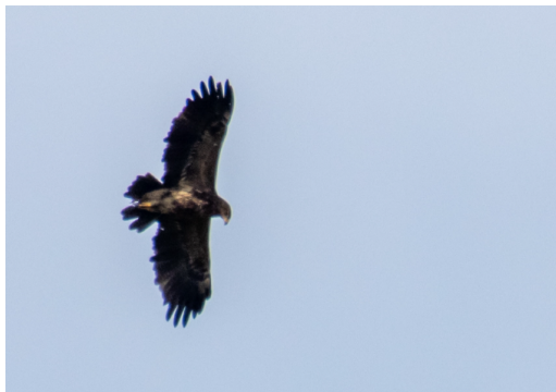
Lille Skrigeørn Sønderborg - øst for Sundet 17/09/2023. Billede 2 af 3

Hvordan gik det de sønderjyske storke i 2023 – et år hvor landsbestanden nåede op på 10 ynglepar. Hvor mange par havde succes? Hvor mange unger kom på vingerne? Læs mere her