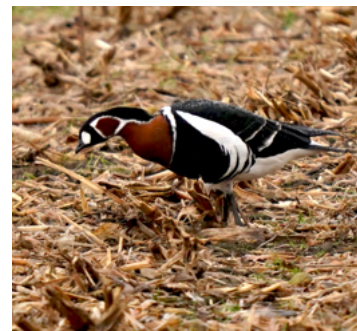
Rødhalsed gås.