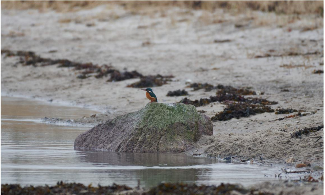
Isfugl Arnkil Skov, Kær Halvø, Sønderborg 24/01/2021.

Vi havde en kort, men heftig vinterperiode i februar med nattetemperaturer på omkring 20 graders frost og et snedækket landskab. Smukt at se på, men hårdt for nogle arter at overleve i – isfuglen har fået et alvorligt knæk: