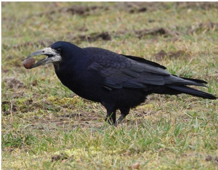
Råge Broager Vestermark 04/03/2021.

https://www.dof-syd.dk/nyheder?nyhed=manedens-fugl-marts-2021