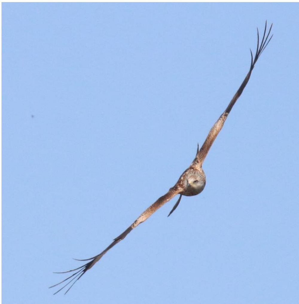
Rød glente Vester Lindet.

Der er dog stadig rigeligt at se til på ynglefugle fronten. For eksempel har rovfuglene store unger nu, som er nemmere at registrere end ellers, når de er fløjet fra reden og er meget vokale. August er også et rigtig godt tidspunkt at registrere unger hos toppet lappedykker, så tag meget gerne ud for at finde dem.