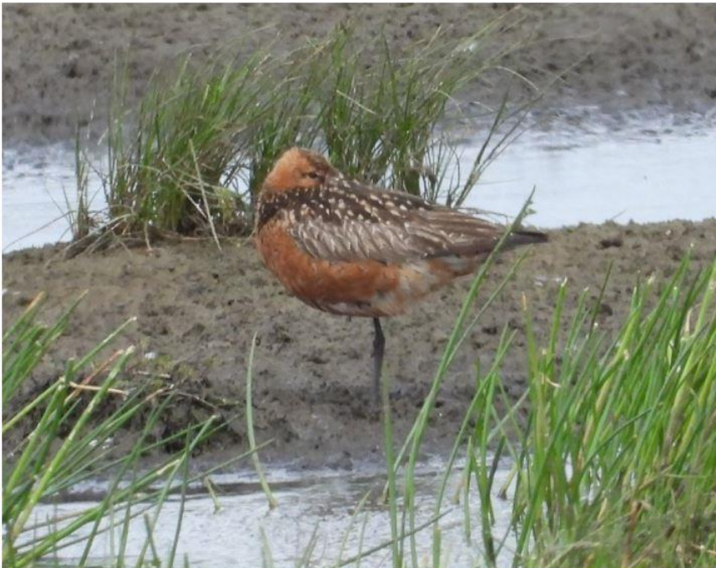
Lille Kobbersneppe Margrethekog Syd (syd for Vidåen) 19/07/2021.

Juli blev en rigtig dejlig sommermåned – tørt, solrigt og med høje temperaturer. De sidste dage er det dog blevet meget lavtrykspræget og der er lokalt kommet voldsomme regnmængder i det sønderjyske. Lokale har målt helt op til 180 millimeter regn ved Fole den 26. juli.