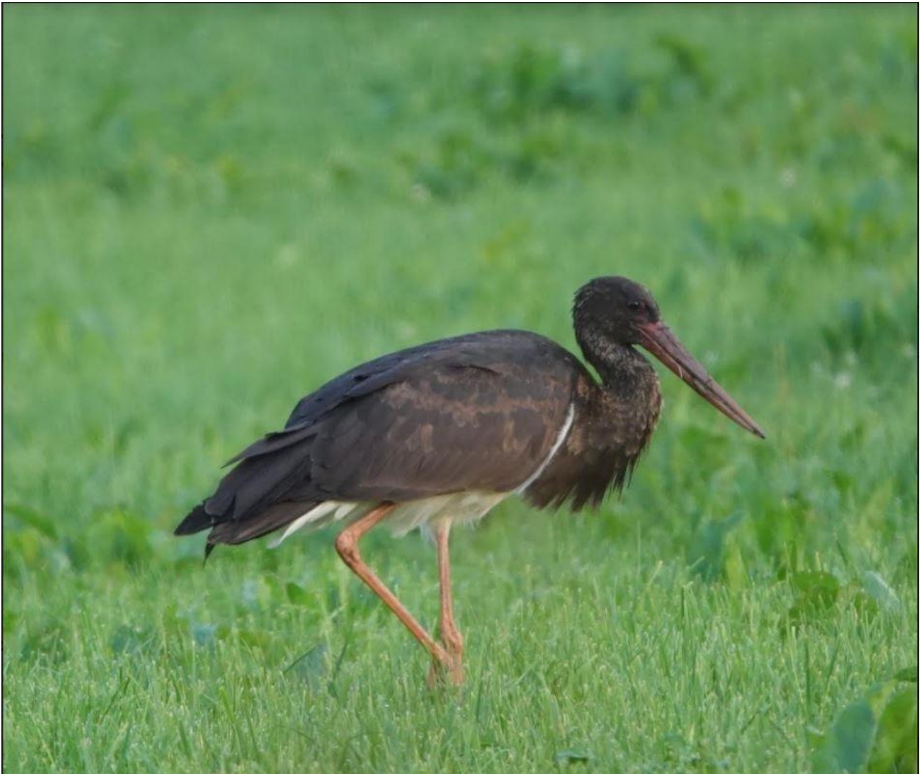
Sort stork fra Bjerndrup.

En søgning i DOFbasen efter sjældne fugle i Sønderjylland i juli måned, giver et væld af vadefugle: Hvidbrystet præstekrave, kærløber, odinshane, prærieløber, sribet ryle og stylteløber. Men den største sjældenhed blev orientbraksvale i Magrethe Kog.