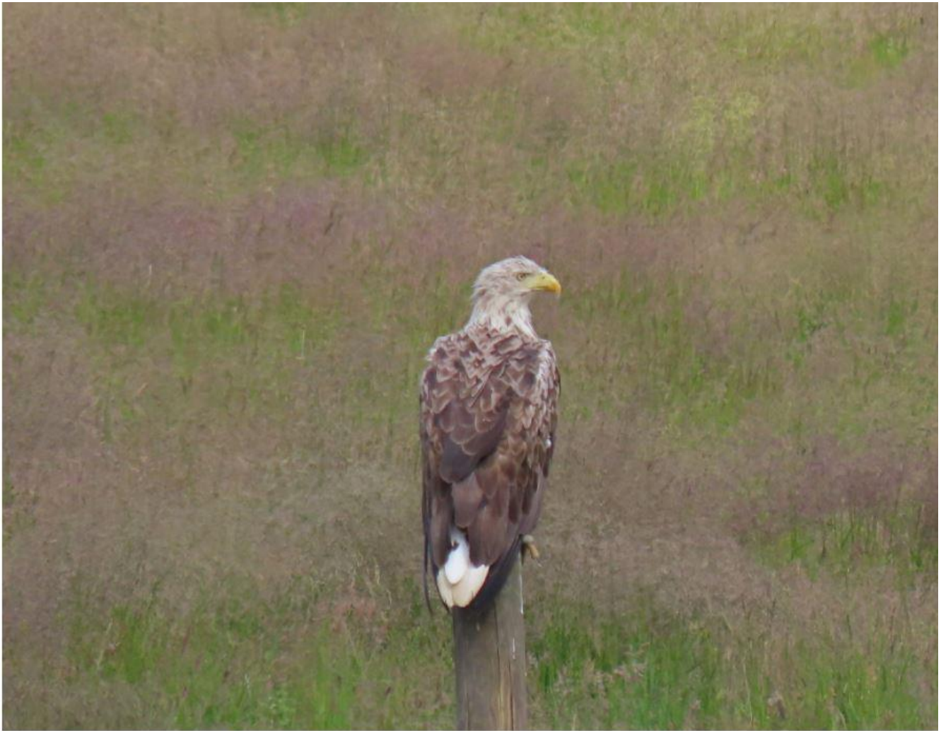
Havørn Ny Frederikskog 27/06/2021.

Hedehøgene er snart ude af landet, og du kan læse årets sidste Nyhedsbrev her: