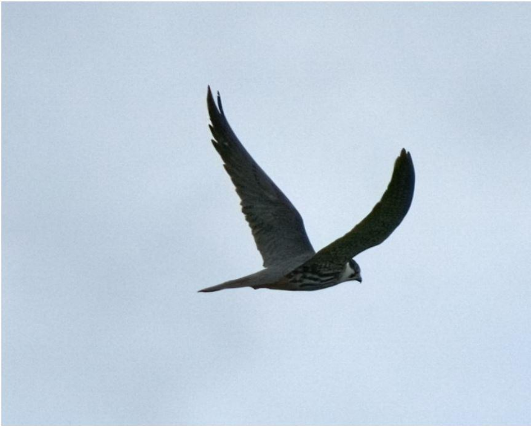
Lærkefalk Slivso, Hoptrup 08/08/2021.

Kystens terner har også haft en god ynglesæson. Der har ikke været kraftige sommerlavtryk, som har medført kuling med oversvømmelse af æg og unger. En anden vigtig årsag til ynglesuccesen er den beskyttelse, der desværre er nødvendig at give strandenes ynglefugle fugle: