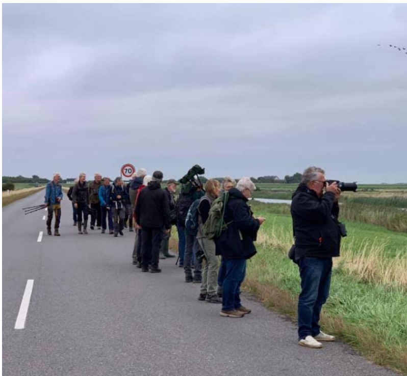
Der ses på fugle på vej ud mod Vidåslusen.

Den 29. august fik vi endelig afholdt generalforsamlingen i DOF Sønderjylland. Vi plejer at afholde den i februar måned, men på grund af corona-restriktioner blev det rykket helt til august måned.