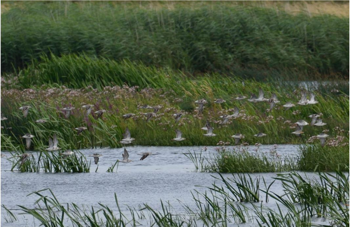
Brushane Nørresø, Tønder (vest for jernbanen) 09/08/2021.

https://www.dof-syd.dk/nyheder?nyhed=manedens-fugl-september-2021