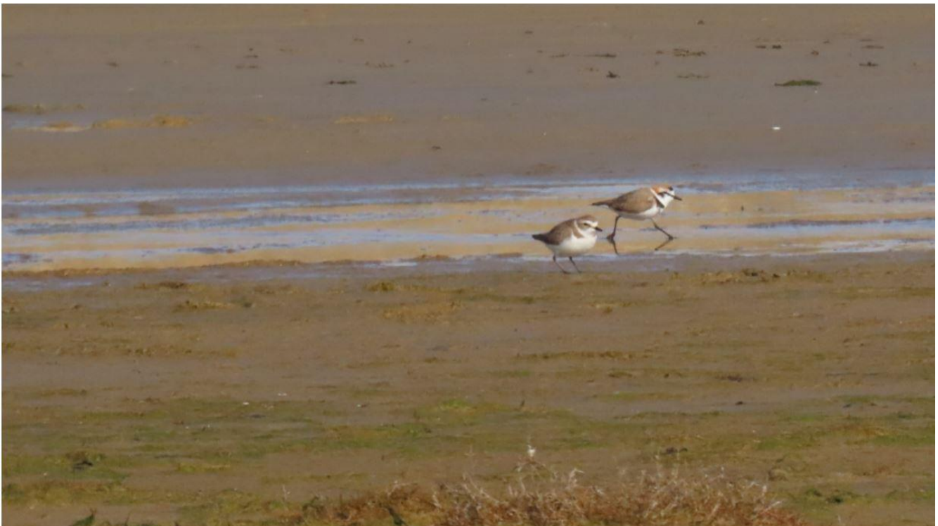
Hvidbrystet Præstekrave Havsand, Rømø 09/04/2021.

April har været en kold omgang, og ender som en af de koldeste april måneder siden årtusindskiftet. Det kolde aprilvejr i hele Europa bevirker, at flere trækfugle kommer en anelse senere end de gennemsnitligt ville gøre. Ellers er der planmæssigt kommet grågæs med gæslinger mange steder, og ravnene fodrer ungerne i rederne.