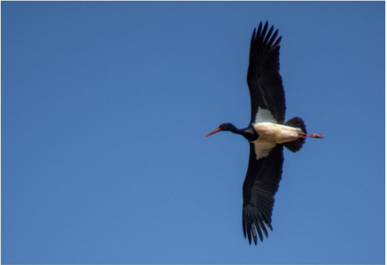
Sort Stork Tinglev Mose 17/04/2021.

Andre arter er set på mere tilfældige lokaliteter. Det har i april været fx sort stork, steppehøg, gulirisk og sort glente.