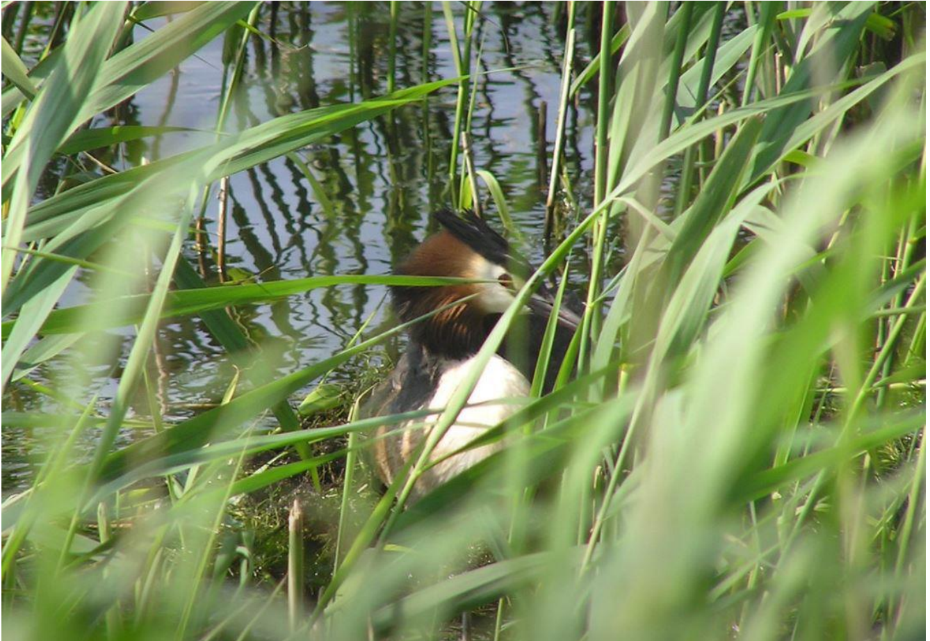
Toppet lappedykker på rede. Godt skjult i rørskoven.

https://www.dof-syd.dk/nyheder?nyhed=novana-optaelling-af-ynglefugle