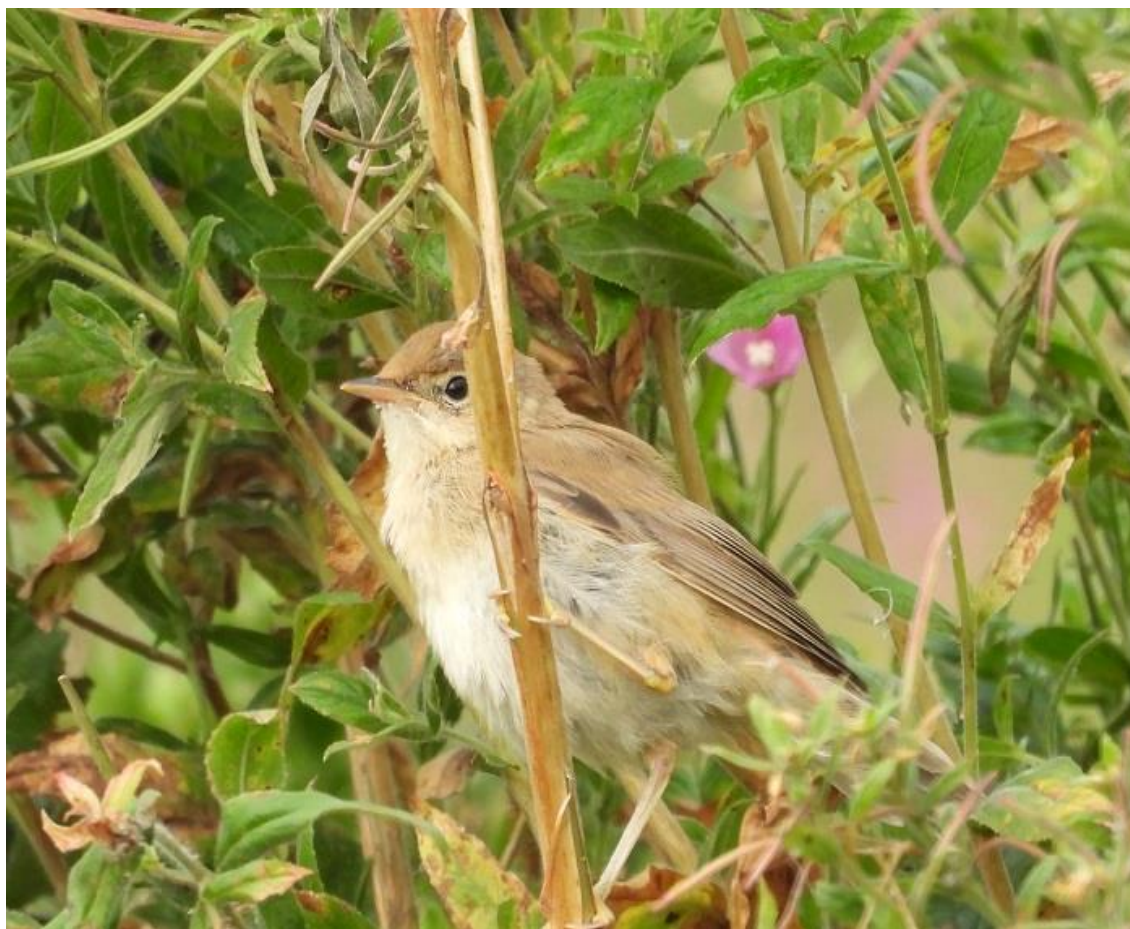
Kærsanger – ved kanalen mellem renseanlægget på Broager Vestermark og Broager Vig Den 12. august 2023

Med maj måned er foråret for alvor kommet, og i denne måned dukker de sidste af vore sangfugle op. Det gælder ikke kun Gulbug og Havesanger, men også Kærsanger. Kærsanger konkurrerer seriøst med Nattergalen om at være den bedste sanger i vor fugleverden. Nattergalen har, som det er kendt af de fleste, en kraftig og meget letgenkendelig sang, som dog er rimelig monoton. Kærsangeren synger også ret kraftigt, men sangen er meget varieret og variabel fra individ til individ.