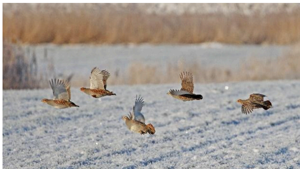
Agerhøns (perdix perdix)

Hver aften kan jeg høre hannens kald: gerrick-gerrick i det samme område, mon der er unger på vej?