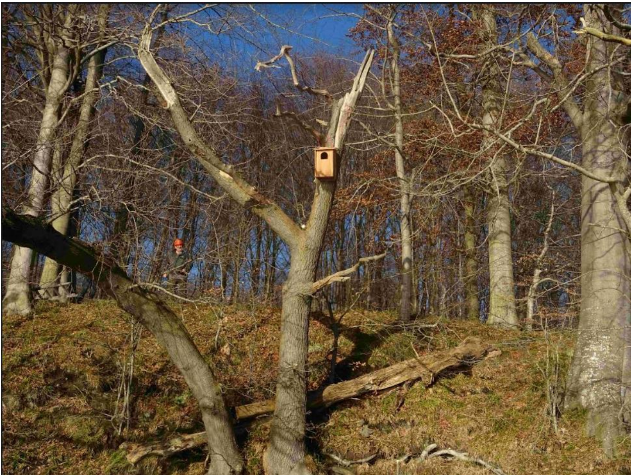
Stor skallesluger-kasse ved Jørgensgård skov.

Efter en succesfuld start med to kasser på Kalvø fortsatte turen sydpå, hvor næste stop var Loddenhøj med en kasse efterfulgt af Skarrev – også med en kasse. Derefter gik turen til Jørgensgård skov på nordsiden af Aabenraa fjord, hvor vi fik hængt to kasser op. Sidste stop var to kasser på sydsiden af Aabenraa fjord, hvor vi afslutningsvis fik kaffe og kage hos lodsejeren.