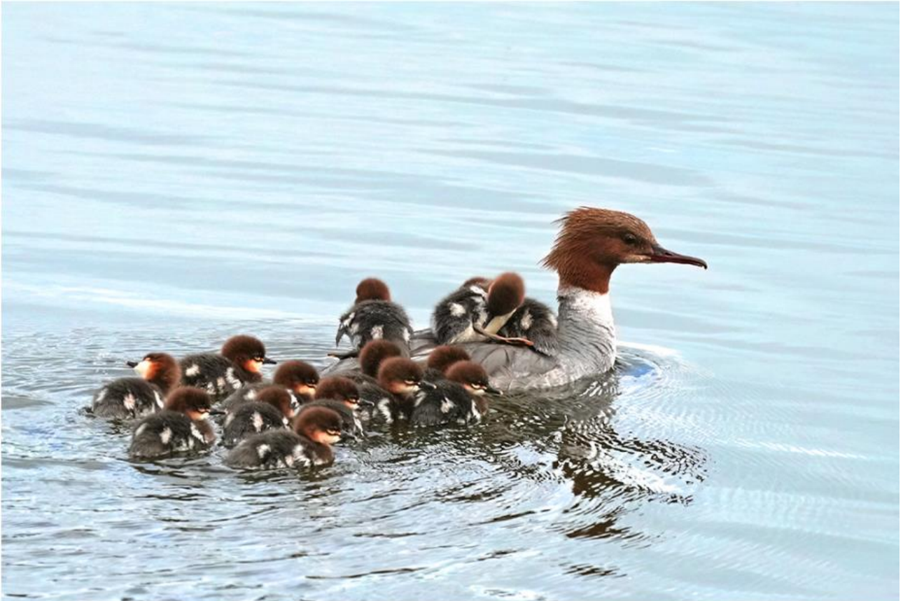
Stor skallesluger hun med 14 ællinger, Gråstensøerne 24.5.2023.

Det skal blive spændende at følge op på, om kasserne bliver brugt af stor skallesluger i år. Hvis vi får succes med projektet, kunne det være oplagt at hænge flere kasser op, og udvide området nordpå langs den sønderjyske østkyst.