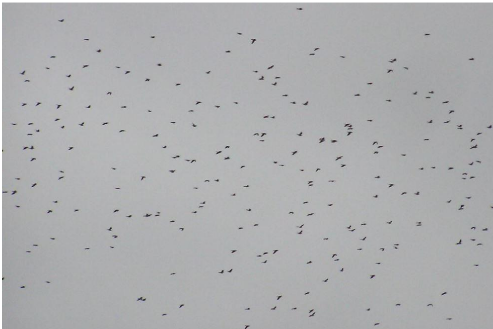
Ringdue flok

Så er oktober ved at være overstået. Der har været godt gang i fugletrækket, og luften har været tyk af sjaggere og vindrosler, og nu er det ringduer som ses i store flokke. Årets sidste landsvale blev set ved Kragssand den 14. oktober, så sommerbebuderne er væk. Det går mod mørke tider og store flokke af gulnæbbede svaner og gæs.