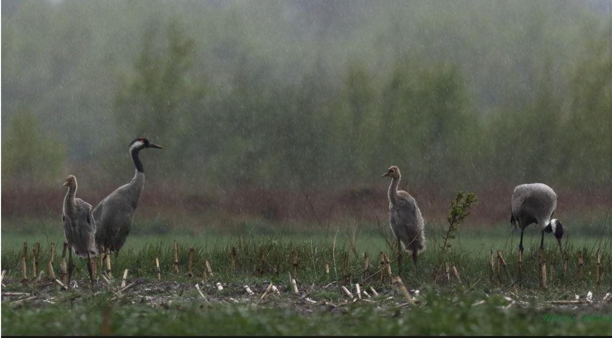
Traner i regnvej

I Sønderjylland er de ynglende traner blevet fulgt tæt siden indvandringen i 2020. Læs lidt om status på hjemmesiden her: https://www.dof-syd.dk/nyheder?nyhed=tranearet-2020