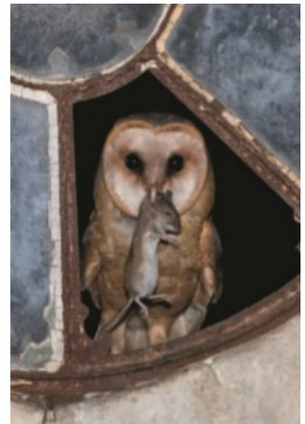
Engene omkring Ketting Nor er jagtmarker for den smukke slørugle, der efterhånden har bredt sig over det mest af Sønderjylland. Den yngler gerne i udhuse og ældre landbrugsbygninger, hvis der er mulighed for at komme ind, f.eks. hvor der mangler en rude.